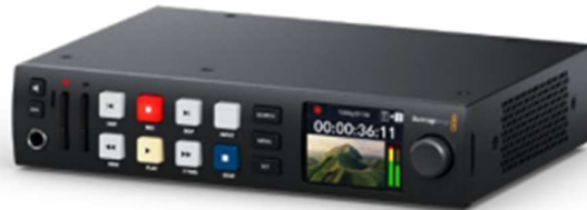
HyperDeck Studio HD Plus

Seluruh model juga dapat merekam ke USB flashdisk dan network storage serta mendukung video HD hingga 1080p60. Berbeda dengan HyperDeck Studio 4K Pro yang mendukung video Ultra HD hingga 2160p60.