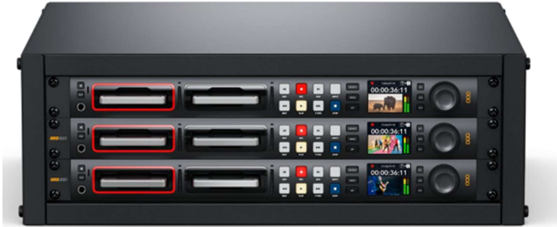
HyperDeck Studio HD Pro and HyperDeck Studio 4K Pro

Perekam HyperDeck studio HD Pro dan HyperDeck Studio 4K Pro dibuat untuk satu unit rak dan cukup besar untuk merekam dan memutar file pada SD dan SSD.