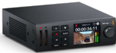
HyperDeck Studio HD Mini